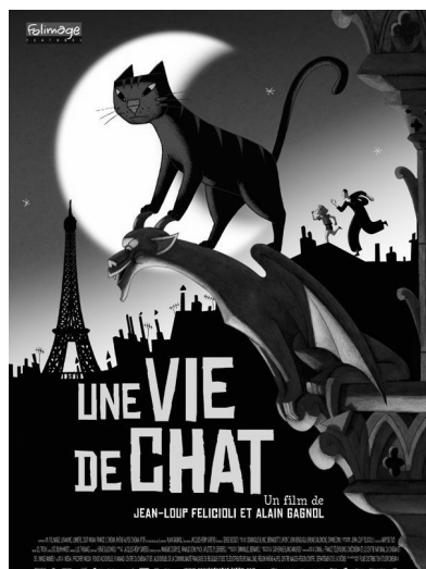
UNE VIE DE CHAT 17 h 00