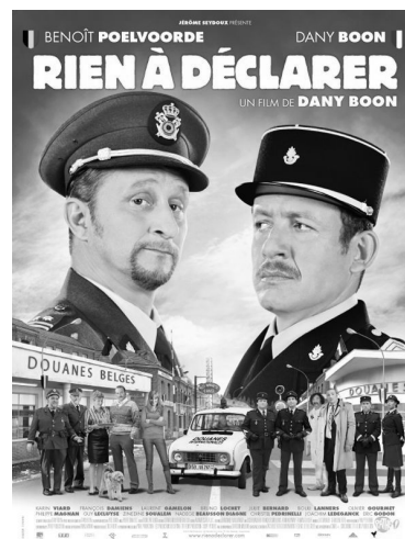
RIEN A DECLARER 20 h 00