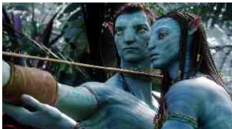
20h : Avatar.