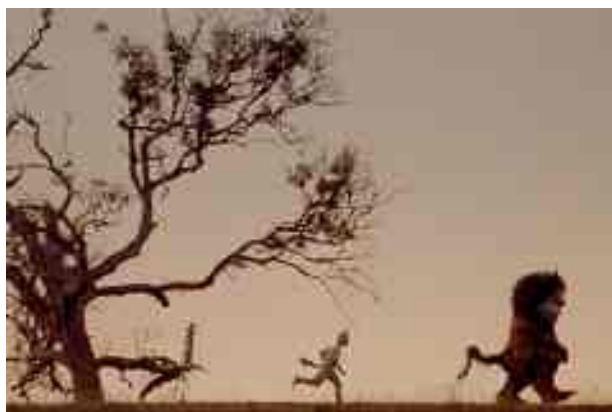
17h : Max et les Maximonstres.