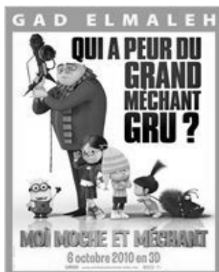
MOI, MOCHE ET MECHANT 17 h 00